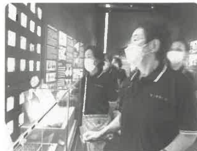
原子力災害伝承館での様子

また、震災発生直後に15mを超える津波に襲われた請戸地区において、的確な判断と速やかな行動により児童、教職員全員が助かった浪江町立請戸小学校（現在は震災遺構）では、当時のままの教室や体育館の他、震災時の避難経路等を見学。4年生教室では、地域の方々の体験談を映像で観賞しました。