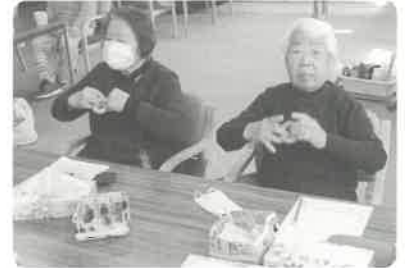
▲ ハンドリングを使用している手指運動の様子