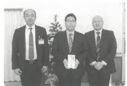
石川地区労働福祉協議会 様