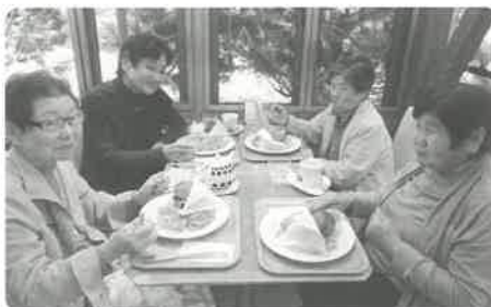
一人暮らし高齢者会食