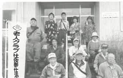
9月27日 (除草作業、剪定) 浅川町長寿会連合会様