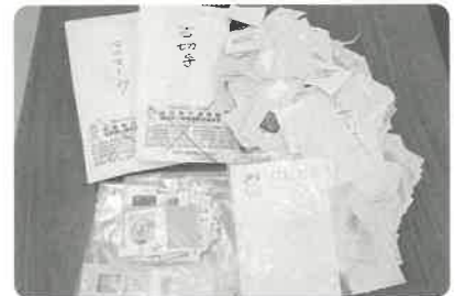
使用済切手等収集のご協力 ありがとうございました