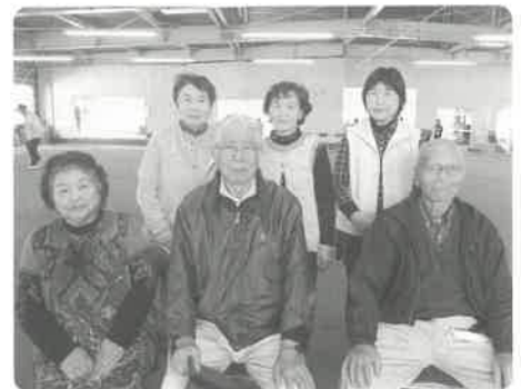
【優勝】山白石北部Aチーム