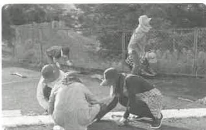
7月5日 (除草作業) 浅川町赤十字奉仕団様