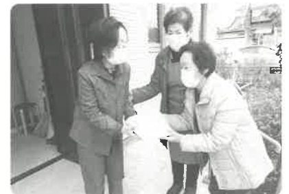
一人暮らし高齢者年末特別給食