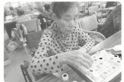
▲ 余暇活動(ぬりえやパズルなど)の様子