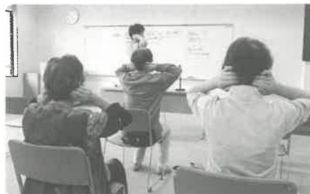
介護者のためのふれあい交流会