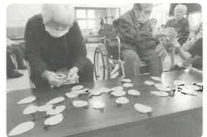
▲ 午後のレクリエーションの様子