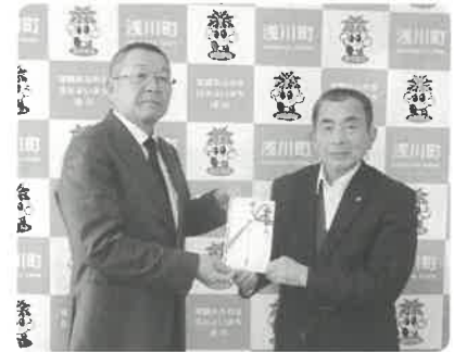
浅川町ゴルフクラブ協議会様

※頂いたゆずは昼食やおやつの材料、ゆず風呂としてデイサービス利用者の方に提供させていただきました。（受付順）