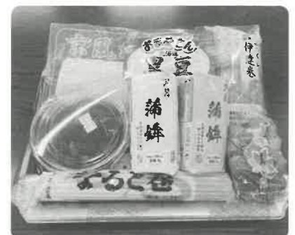
一人暮らし高齢者年末特別給食