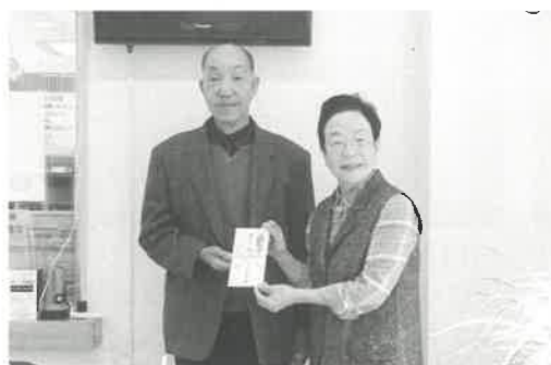
浅川町赤十字奉仕団様