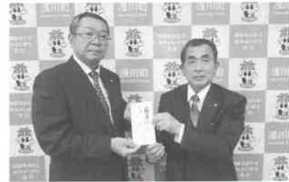
浅川町ゴルフクラブ協議会様