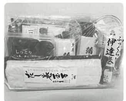
年末特別給食 (12月22日実施)