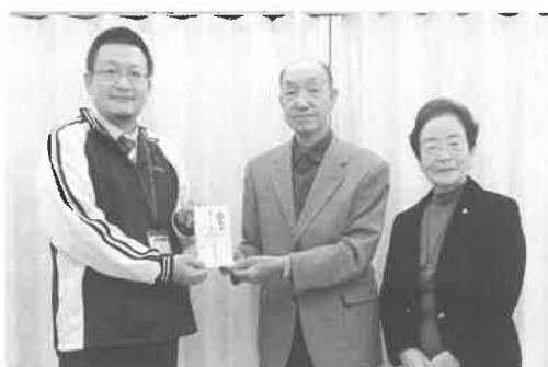
浅川町赤十字奉仕団様