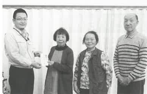
浅川町赤十字奉仕団様